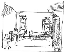
Рисунок внутренности. Цвета и композиция показаны в виде эскиза.