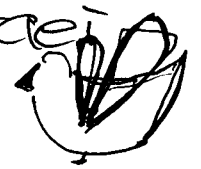
птица развела крылья

затем их разводит, таким образом она летает 2